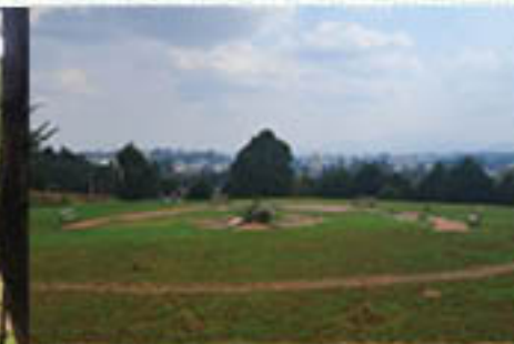
ለፎቶ ለሰርግ የሚሆኑ ቦታዎች