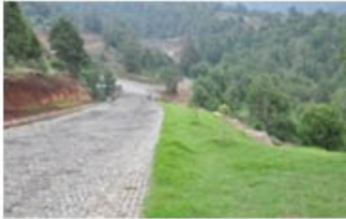
የውስጥ ለውስጥ የኩባሪዎች መንገድ

ማዕከሉን ለተገልጋዩ የህብረተሰብ ክፍል በተሻለ ሁኔታ ተደራሽ እና ምቹ ለማድረግ የሚያስችሉ በርካታ የመሰረተ ልማት ስራዎች በመከናወን ላይ ናቸው።